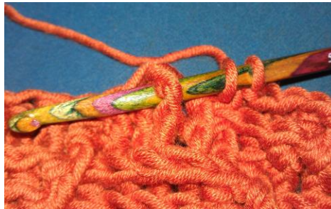
Reliefstäbchen von vorne