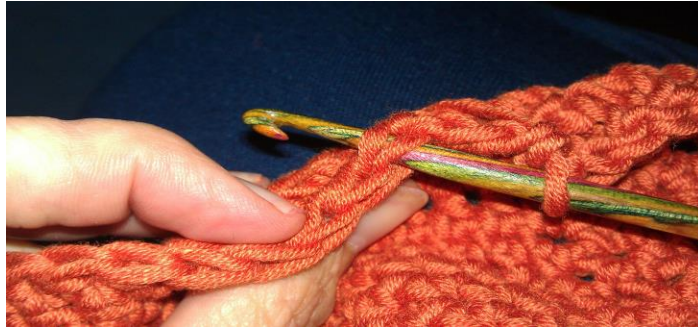
Einstechen in hintere Maschenglieder