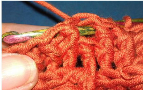
Reliefstäbchen von hinten